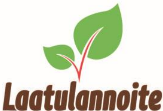
Kuva 1: Laatulannoite-järjestelmän logo

Laatulannoite-sertifikaatti on kansallinen laatu-järjestelmä kierrätysravinteista tuotetuille lannoitevalmisteille. Sertifikaatti osoittaa, että tuote on laatu-järjestelmän mukainen. Sertifikaatin omaavat yritykset voivat hyödyntää Laatulannoite-tuotemerkkiä niiden tuotteiden pakkauksissa ja markkinoinnissa, jotka ovat laatu-järjestelmän piirissä. Laatulannoite-sertifikaattia voivat hakea kaikki halukkaat kierrätyslannoitteita valmistavat yritykset.